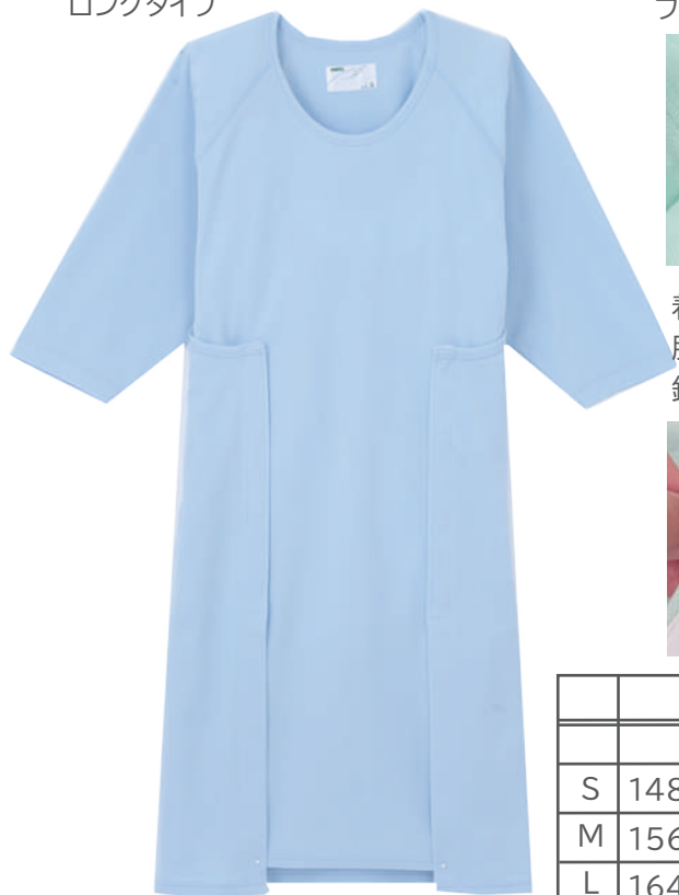
フラットな縫製部分。